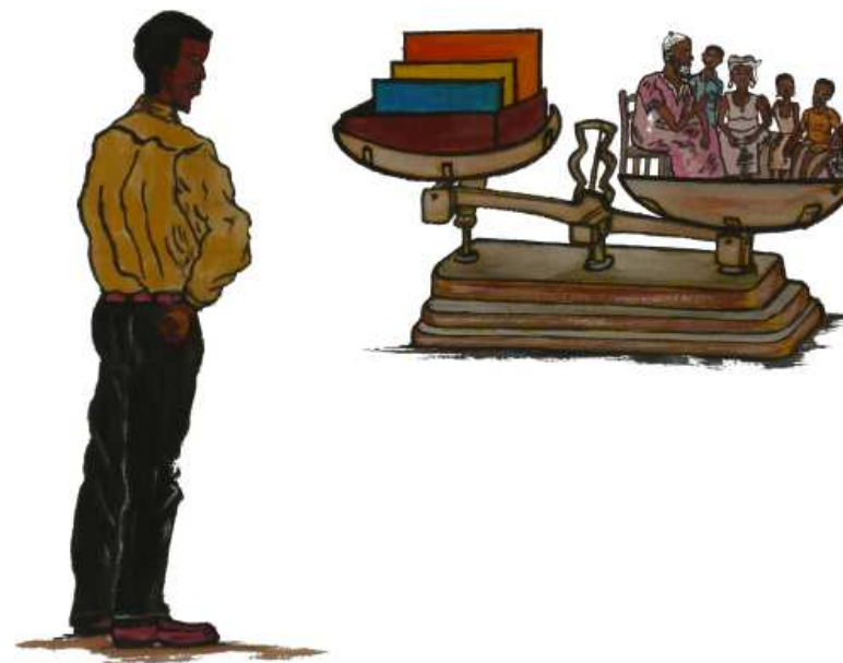
Le directeur perplexe

Lorsqu'un besoin d'argent survient, une famille fait appel à ceux de ses membres qui peuvent payer en fonction de leurs niveaux sociaux, du degré de parenté, de la gravité du problème à résoudre. En résultat, un directeur est tenu de financer les