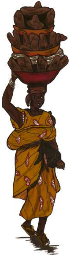
La vendeuse d'ignames