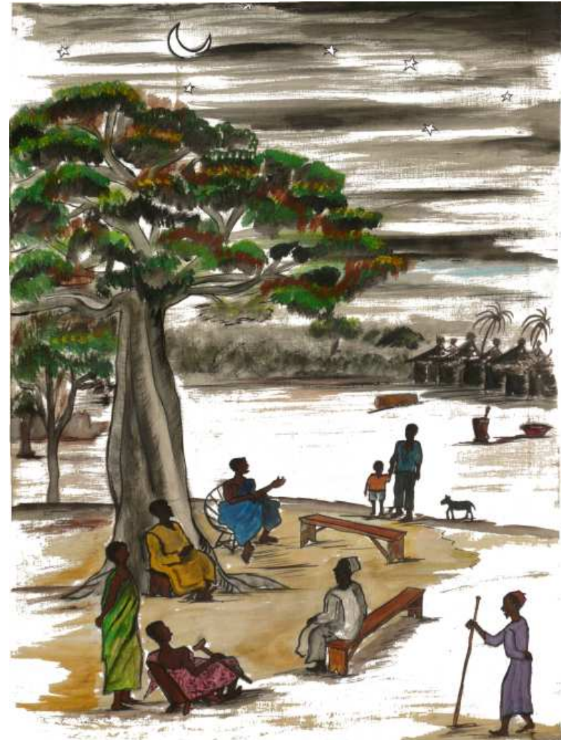
À la tombée de la nuit, la palabre...

Il paraît que la « démocratie » fait défaut aux gouvernements africains... ne s'agirait-il pas plutôt de légitimité ? Donc de consensus à l'échelle nationale ? Mais alors, des élections appuient-elles dans le bon sens ?