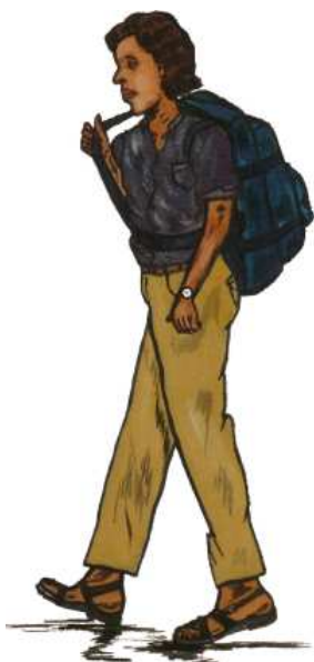
Le voyageur libre

Les Occidentaux ont construit un monde en conflit avec les fonctionnements communautaires initiaux. Et l'individu occidental, lorsqu'il se confronte au reste du monde, parcourt en sens inverse le chemin de sa civilisation.